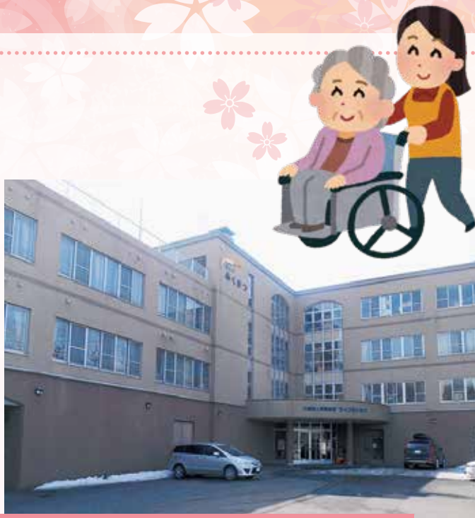
介護老人保健施設 ライフふくまつ

同じ地区にあります介護老人保健施設アメリティ西岡とともに、ご利用者一人ひとりのニーズに合わせた看護、介護、リハビリテーションの提供を行い、在宅生活の支援を進めていきます。